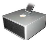
Multiline - Einstecken der Pipeline "E-Connect"